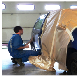
Peinture en Carrosserie

Ce dossier est à compléter par la famille et par l'employeur avant de prendre RDV auprès du CFA au 02.32.86.53.01.