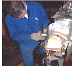
Réparation des Carrosseries